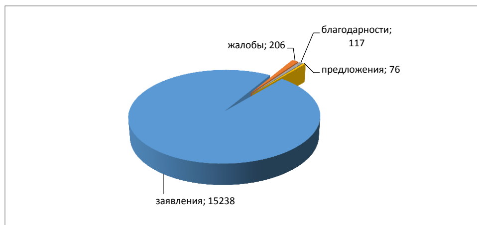
Диаграмма 2. Сведения об обращениях, поступивших в отчетном периоде, в разрезе их видов

По территориальной принадлежности наибольшее количество обращений в 2015 году поступило из городов Сургута, Нижневартовска, Ханты-Мансийска, Мегиона, Нефтеюганска, а также Сургутского и Кондинского районов.